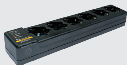
PMLN7102 / PMLN7162